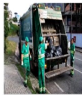
COLETORES DE LIXO