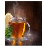
15- TEA: CHÁ

Encontre no caça-palavras abaixo, os nomes (em inglês) das figuras que estudamos no BREAKFAST. Pinte as palavras de RED (vermelho).