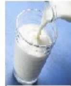
10- MILK: LEITE