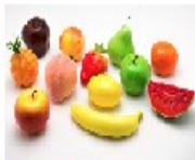
8- FRUITS: FRUTAS