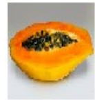
12- PAPAYA: MAMÃO