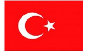
BANDEIRA DA TURQUIA

HOJE, O SÍMBOLO COM A LUA E A ESTRELA APARECE EM ALGUMAS BANDEIRAS NACIONAIS E ATÉ MESQUITAS.